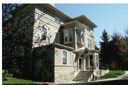
Maison Macdonald-Mowat, 63, rue St. George