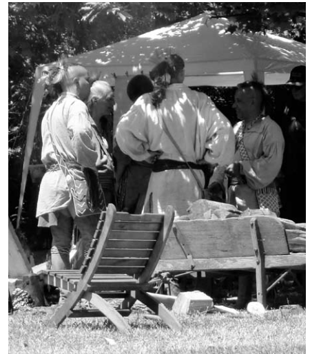
Festival des Arts Métis.